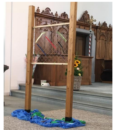
Text und Foto: Ida Birrer

Am letzten Schultag, am 5. Juli fand die Schulschlussfeier der Primarstufe statt. Die 6. Klässler gestalteten diesen kurzweiligen Gottesdienst mit ihrer Religionslehrerin Ida Birrer. Das Thema der Feier hiess «Wir knüpfen das bunte Band des Lebens». Als Höhepunkt erzählten die Schüler/innen die Geschichte «Wir knüpfen das bunte Band des Lebens». Mit dem Wunsch begleitet, dass das leuchtende und bunte Lern- und Freundschaftsnetz, welches in der Schule geknüpft wurde, bis nach den Sommerferien hält, wurden alle in tolle Sommerferien entlassen.